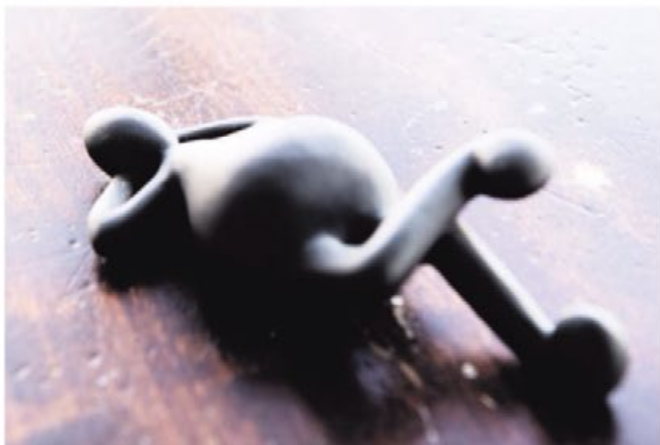
Inspirationen til noderne fra Royal Copenhagen fik hun fra sin farfar, som komponerede melodier.