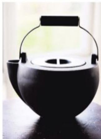
Kedlen eller vandfordamperen har hun designet til brændeovnen.