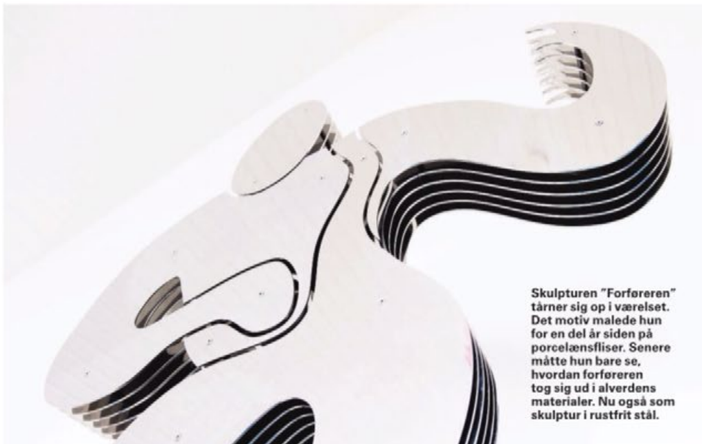
Skulpturen "Forførelsen" tårner sig op i værelset. Det motiv malede hun for en del år siden på porcelænsfliser. Senere måtte hun bare se, hvordan forførelsen tog sig ud i alverdens materialer. Nu også som skulptur i rustfrit stål.