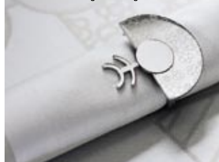
Humans servietring fra Georg Jensen Damask.