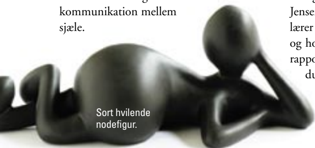
Sort hvilende nodefigur.